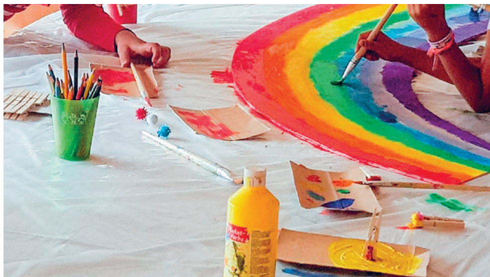
In gemeinschaftlicher Arbeit entsteht ein glitzernder Regenbogen.

Mit dem Lied «Schoggo Loco» wird am Nachmittag das Lindtmuseum in Kilchberg gestürmt. Wir erfahren Interessantes über die Herstellung von Schokolade und dürfen erste bittere, sandige Muster probieren. Beim Automaten mit Flüssigschokolade wird der Löffel mehrmals darunter gehalten und manche Lindorkugel verschwindet in der Jackentasche, um zu Hause genascht werden zu können.