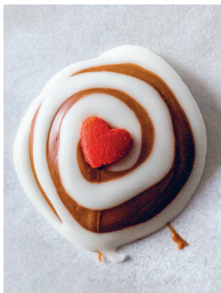
Schokolade selber giessen und verzieren.