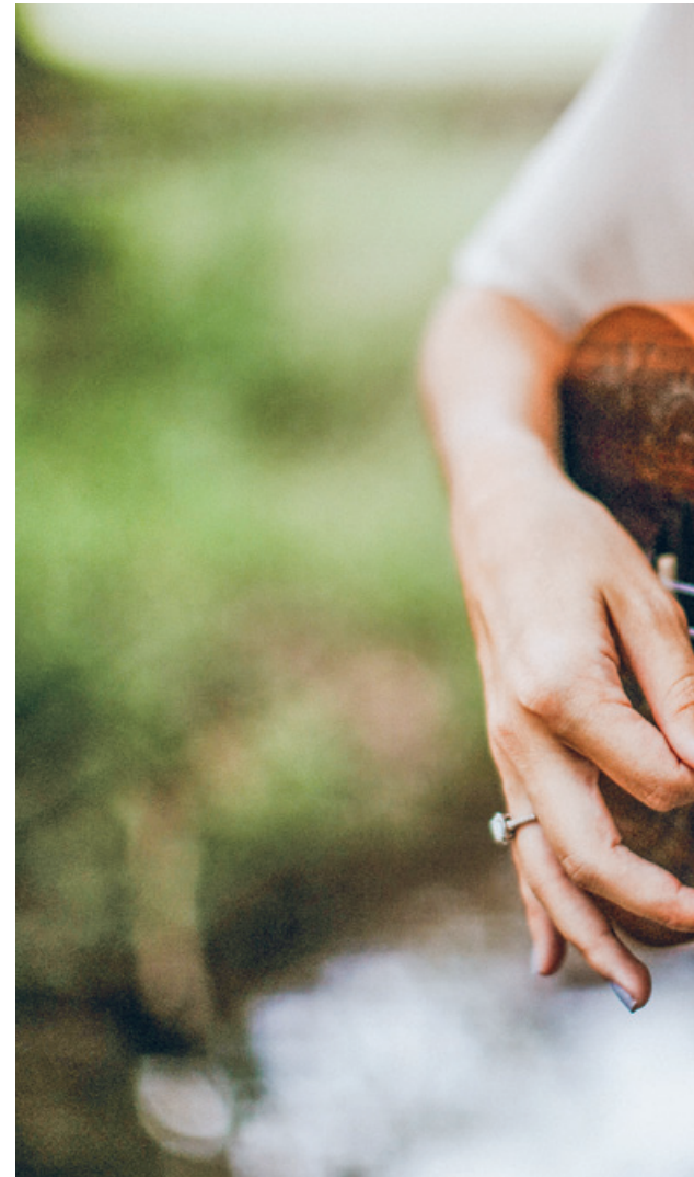
Musizierend oder singend Gott preisen gibt Kraft.