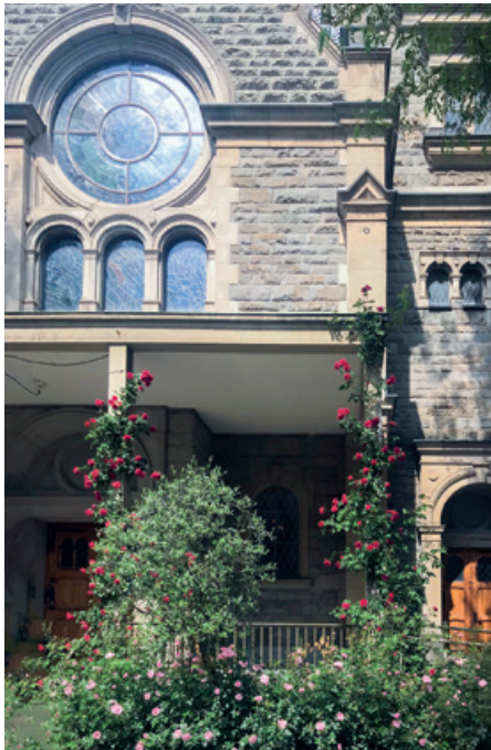
Bald erwacht die Kirche aus dem Dornröschenschlaf.

Über die Sommermonate haben manche von uns immer mal wieder neugierig in den Kirchenraum hineingespäht. Meistens war nicht allzu viel zu sehen. Der Boden war mit beiger Schutzplane bedeckt, der Raum mit Gerüsten verstellt.