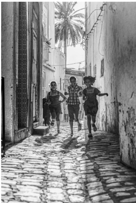
Das Bild ist Teil einer Ausstellung in der Photobastei.