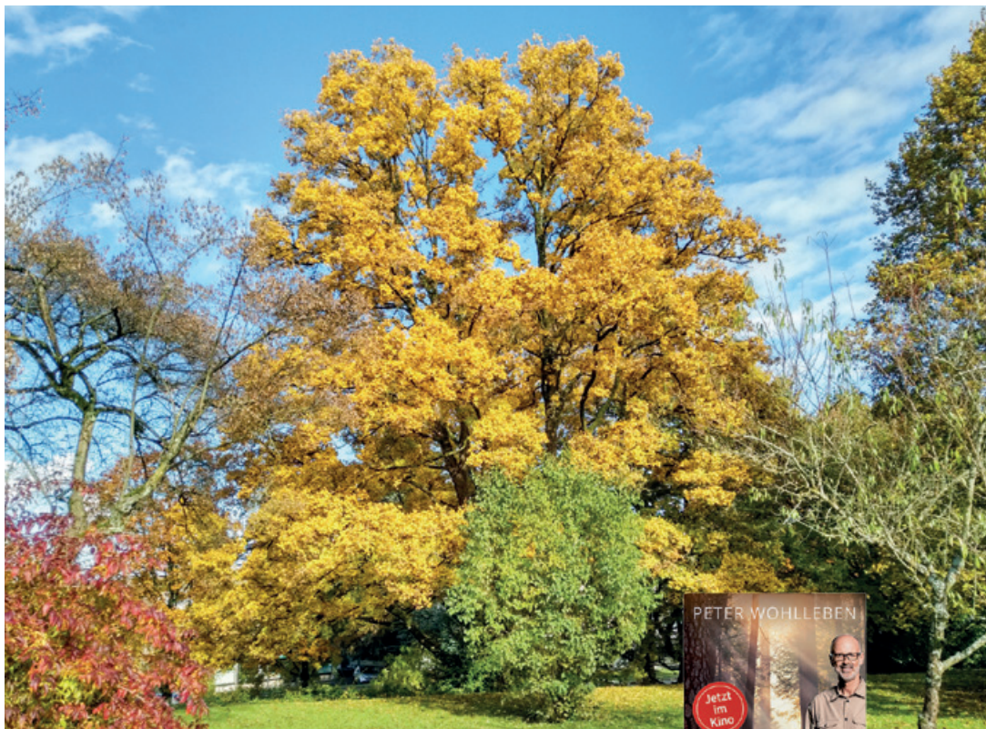
Ein über hundert Jahre alter Feldahorn bei der Kirche Schwamendingen.

mit Live-Musik Konzerteinführung: 17h Kirche Oerlikon