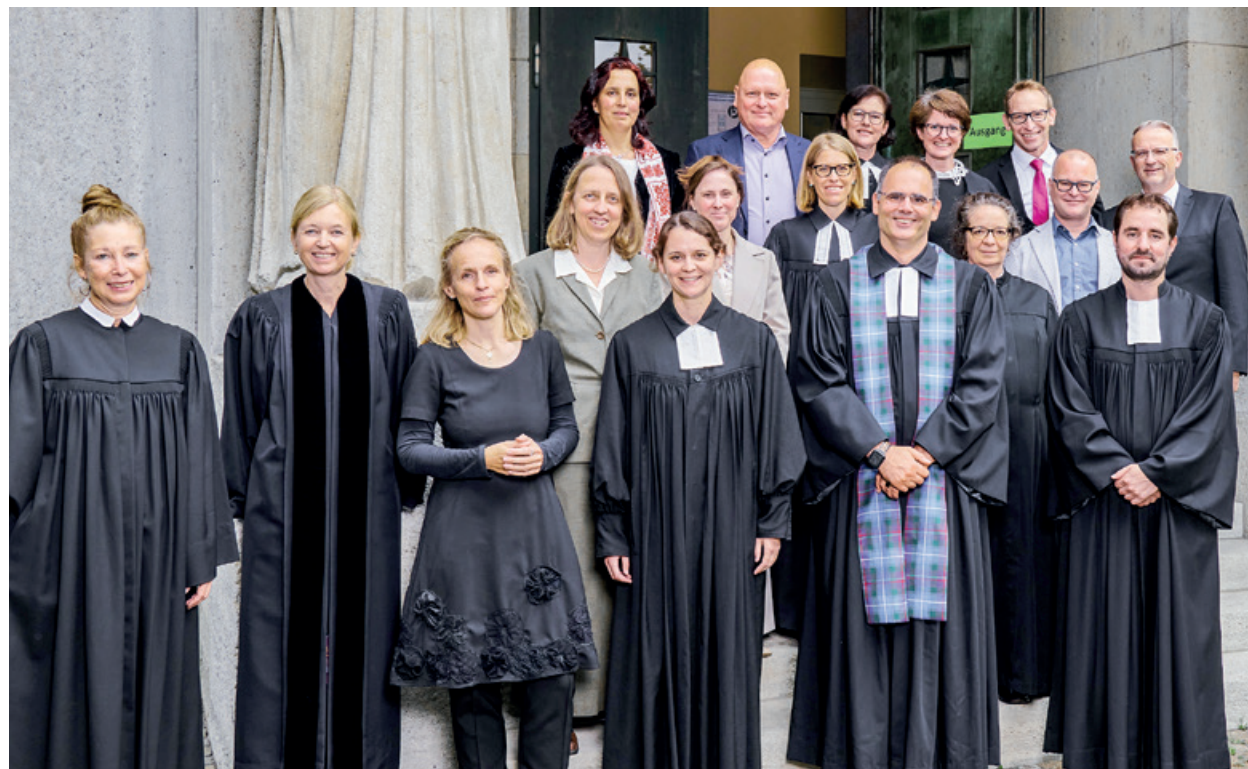
Diese 17 Pfarrfrauen und Pfarrer wurden feierlich in ihr Amt eingesetzt: