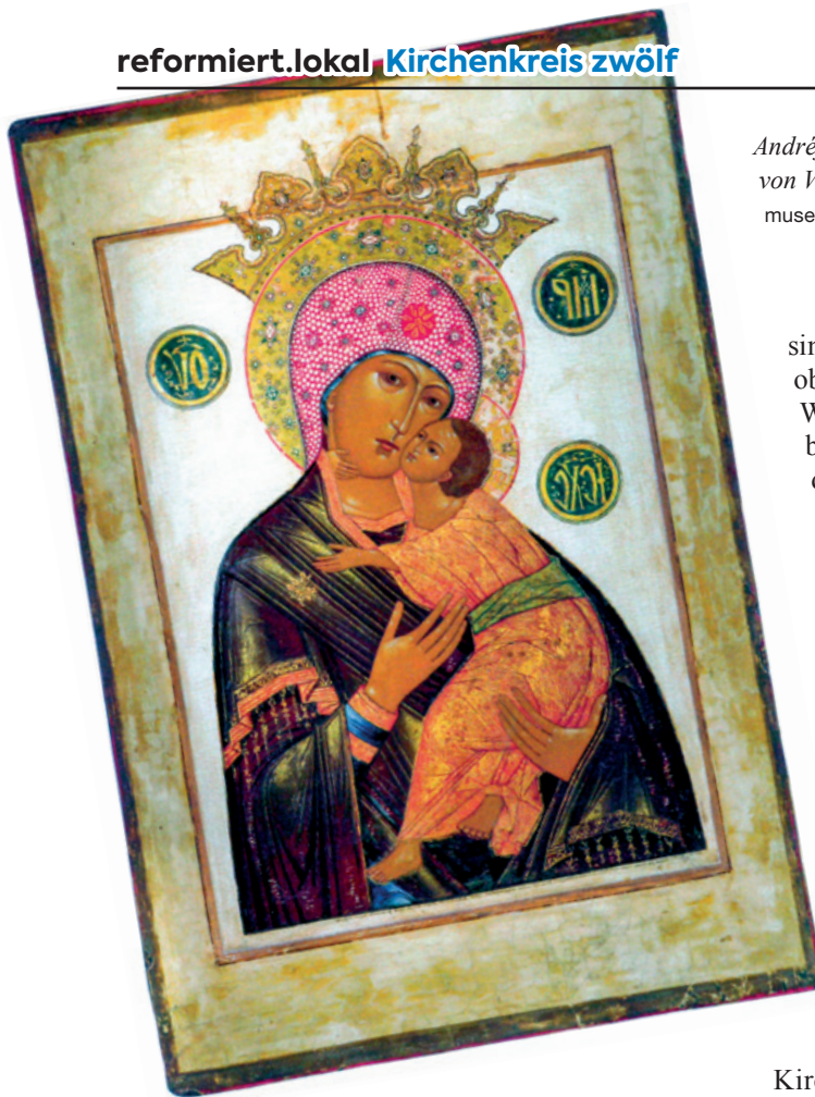
Andréj Fëdorov: Gottesmutter von Vladimir.

Freitag, 27. August, 14.30 Uhr Schwamendingenstrasse 55, 8050 Zürich Unkostenbeitrag 10 Franken