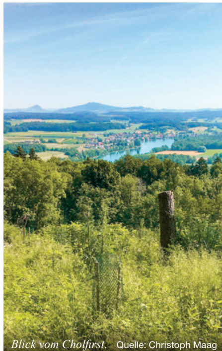
Blick vom Cholfirst.

Wir starten in Schlatt TG, steigen alsbald um 165 m in die Höhe, passieren die Kantonsgrenze TG/ZH beim Kyburgerstein, wandern stets im Wald in nordwestlicher Richtung am Sendeturm vorbei bis nach Feuerthalen. Wiederholt hat es schöne Durchblicke auf den Rhein, in den Hegau und zum Munot.