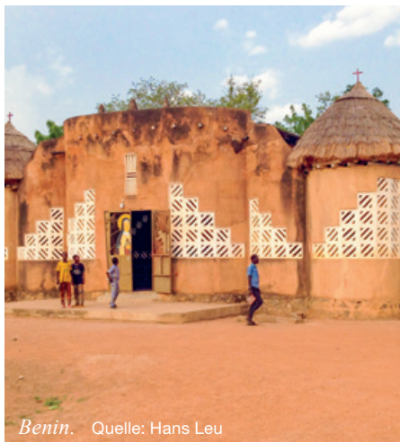
Benin.