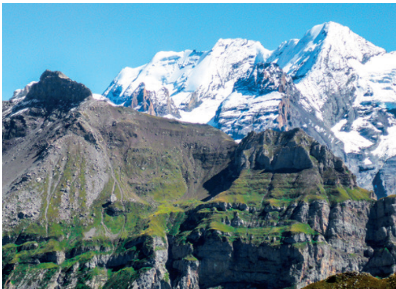
Berner Alpen, vom Eggishorn aus gesehen.