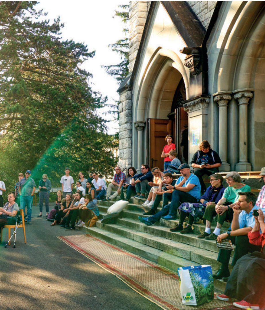
der «Klimaanlage» in der alten Kirche Wipkingen.

der sogenannten Klimaanlage aus? Zurzeit ist eigentlich immer jemand dort: Eine Gruppe, die eine Sitzung abhält, oder einfach Personen, die sich treffen. Auch im Garten läuft viel: Wir haben Hochbeete gebaut und bepflanzt. Mit grösseren Events sind wir allerdings noch vorsichtig.