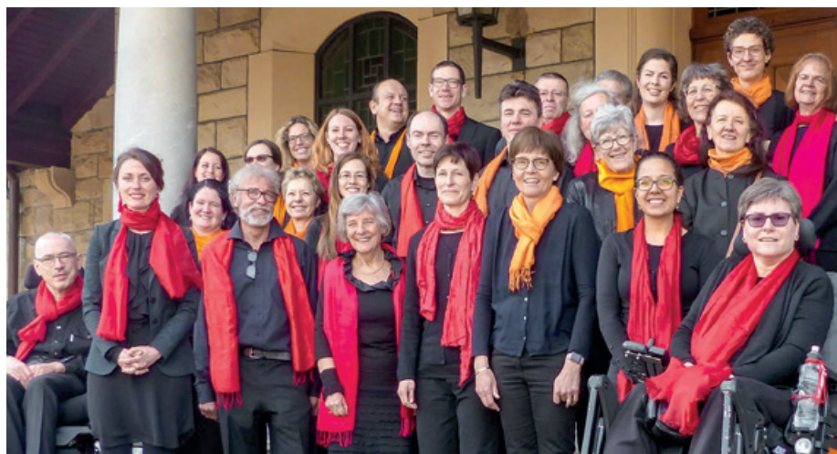
Unsere Stimmen können wieder erklingen.

Am Donnerstag, 26. August, wollen wir die Proben in der Kirche Oerlikon (bzw. in der Bullinger-Stube) wieder aufnehmen. Selbstverständlich halten wir uns an die dann geltenden Corona-Schutzmassnahmen. Gleichzeitig appellieren wir an die Solidarität und Eigenverantwortung: Geimpft, (selbst) getestet oder genesen. Und wer unter