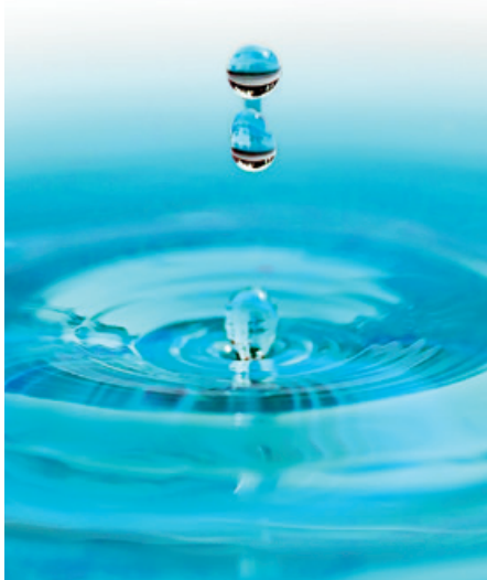
Spritzendes Nass.

Wasser ist der Urstoff allen Lebens. Es ermöglicht Leben im Garten Eden, ist aber zugleich als Wasser der Urflut eine kosmische Chaosmacht, die, wie die Sintflutgeschichte deutlich macht, alles Leben wieder auslöschen kann.