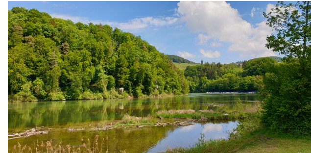
Wandern tut gut dem Körper, Geist und Seele! (Bild: Tössriederen/Eglisau)