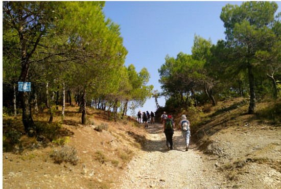
Pilgernd unterwegs nach Assisi.