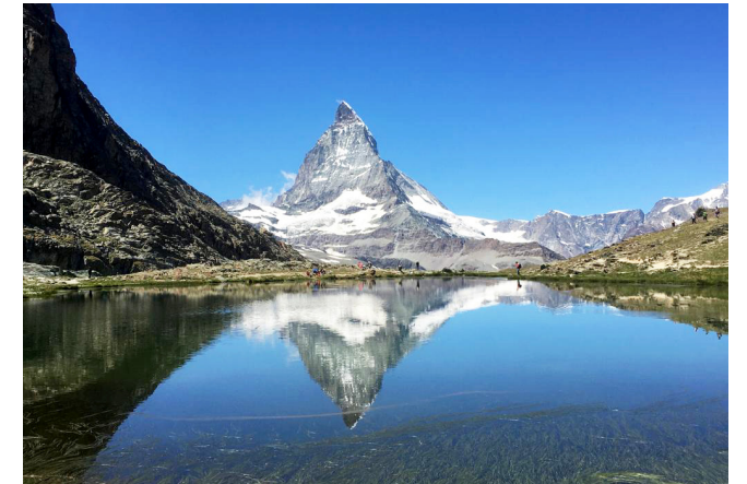
Matterhorn, August 2020