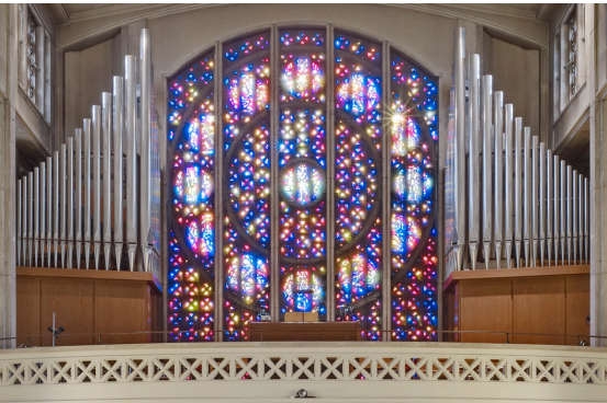
Die Orgel in Dreikönigen