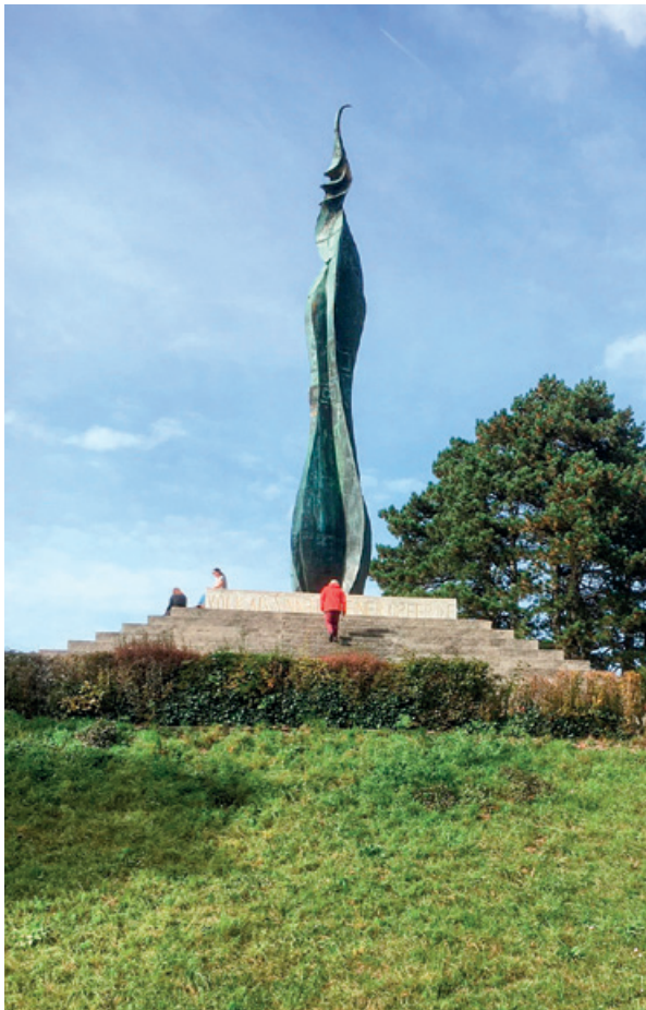
Das Forchdenkmal.