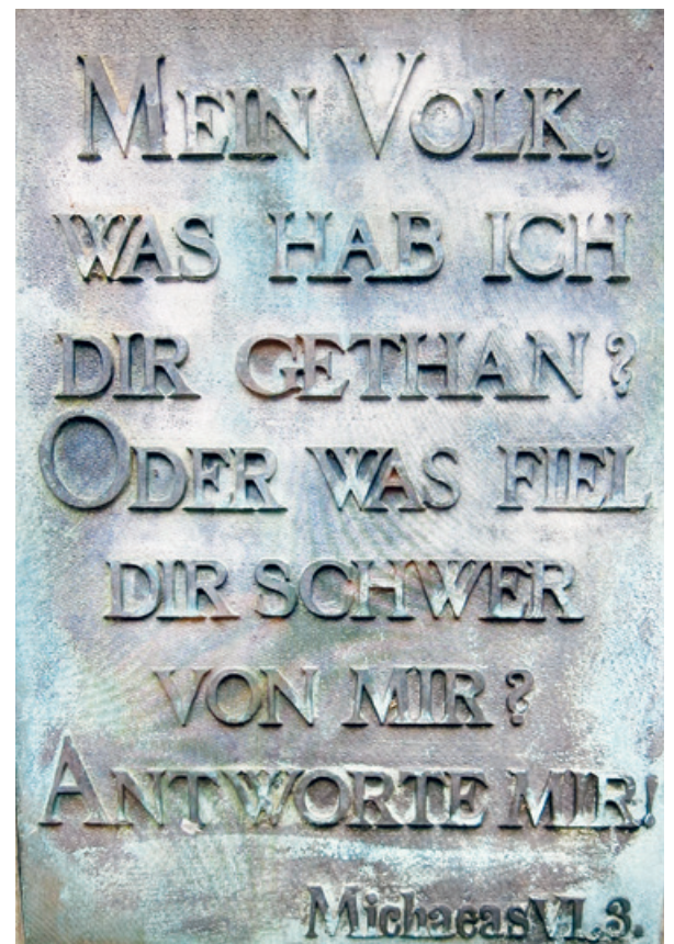
Tafel am Marienbrunnen in Freiburg i.Br.