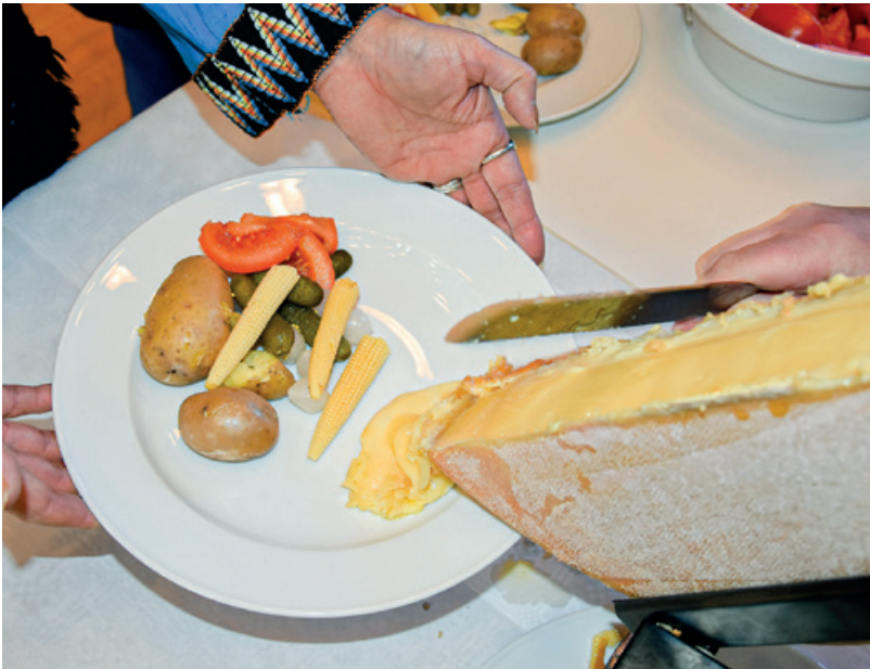
Traditionelles Raclette.