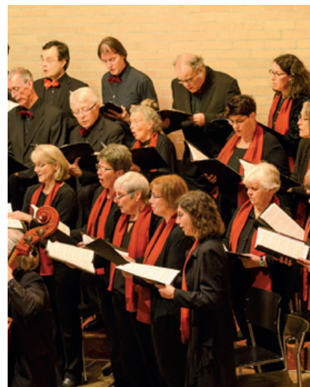
Adventskonzert der Kantorei 2019.