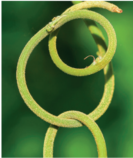
Improvisation einer Schlingpflanze.