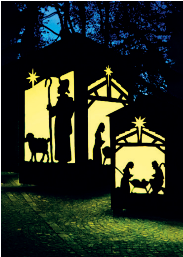
Weihnachtsstimmung mit Laternen.