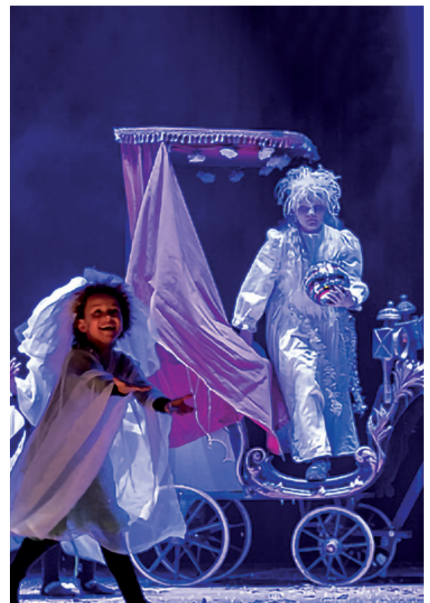
Faszination gut und böse.

Ein Kunstmärchen nach Hans Christan Andersen, Musik von Paul Burkhard.