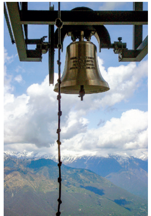
Glocke mit Weite auf dem Monte Tamaro/TI.