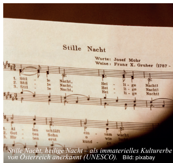
Stille Nacht, heilige Nacht – als immaterielles Kulturerbe von Österreich anerkannt (UNESCO).

Das Konzert finden Sie über die Homepages des Kirchenkreises zwölf und christiangautschi.ch oder suchen direkt auf youtube.com «Christian Gautschi» .