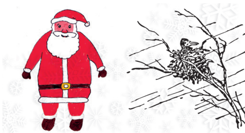
Nikolaus im Schneegestöber und in der Kälte.

Freitag, 18. Dezember, 14.30 Uhr Unkostenbeitrag 10 Franken