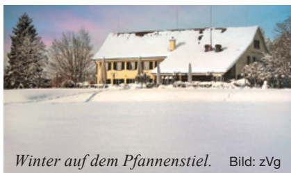
Winter auf dem Pfannenstiel.

Alter Tradition gemäss erklimmen wir den Pfannenstiel und geniessen dort im Restaurant Hochwacht ein winterliches Fondue. Wir erreichen unser Ziel in zwei Gruppen: Gruppe A unternimmt eine Wanderung von 1½-stündiger Dauer ab Männedorf (Widenbad). Gruppe B erreicht die Hochwacht in einem viertelstündigen Aufstieg ab Meilen (Vorderer Pfannenstiel)