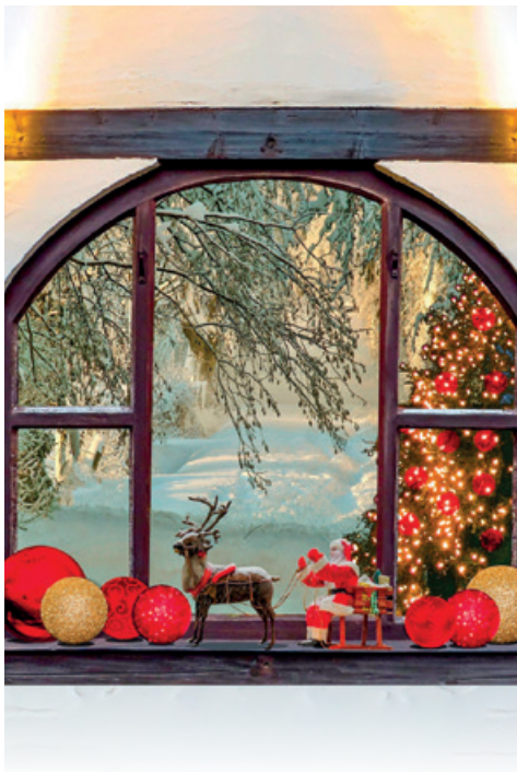
Fenster zum Advent. Bild: pixelio