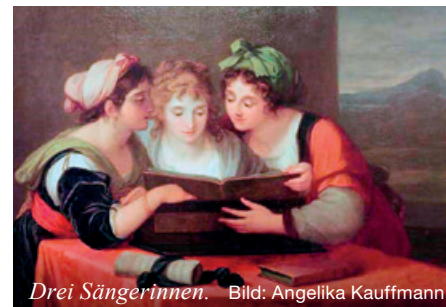
Drei Sängerinnen. Bild: Angelika Kauffmann

Alle Jahre wieder, zum Geburtsfest des Christus Jesus, sitzen wir besinnlich zusammen und beschenken uns. Nur: Wird es im diesem Jahr auch so besinnlich sein?