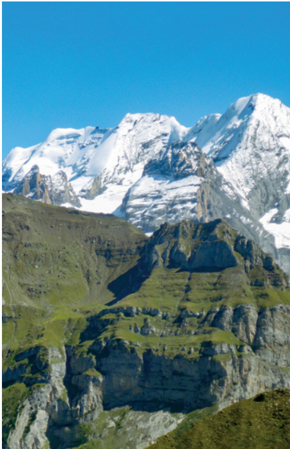
Blick vom Elshorn über Kandertal Richtung Blümlisalp und Doldenhorn.