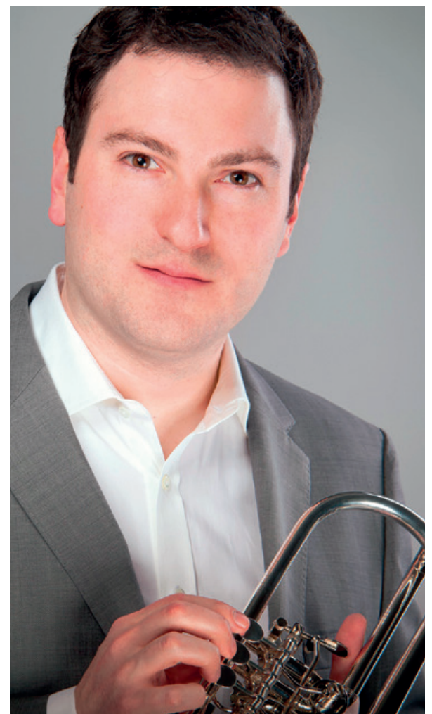
Markus Tannenholz.

Obwohl vieles ungewiss ist, können wir Ihnen eines zusichern – eine unvergessliche Stunde mit Musik, Licht, Wärme und Freude. Herzliche Einladung!