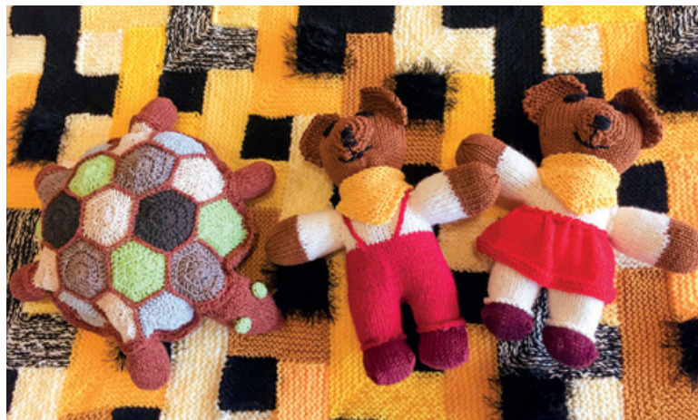
Vielfältige Auswahl und Geschenkideen für Gross und Klein.

mit dem «Chlausspiel» Weihnachtsaufführung mit Kindern aus dem Kirchenkreis zwölf Kontakt: Ruth Tobler, 044 311 45 00 oder Frank Zielinski, 044 312 24 97 Kirchgemeindehaus Oerlikon