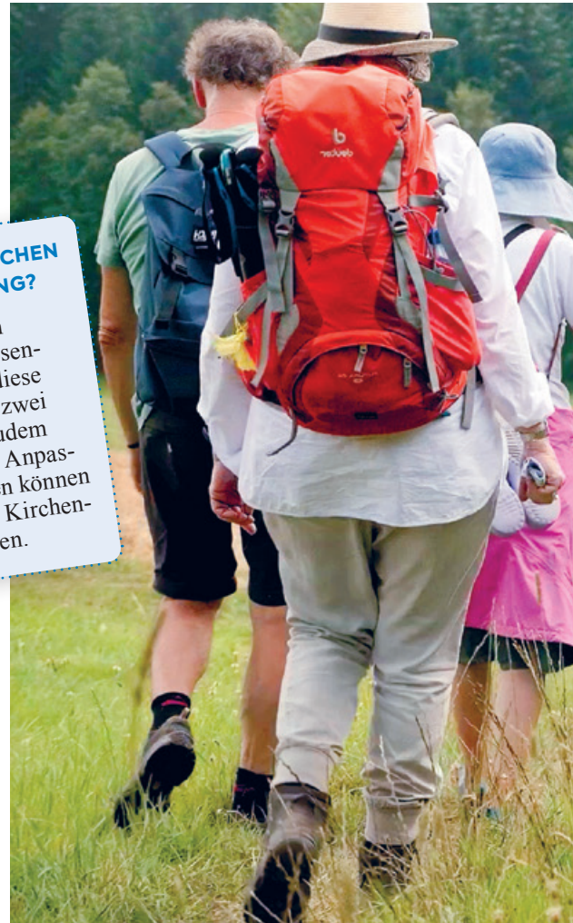
Eine Pilgerreise bietet viel Raum und Zeit für Reflexion: Pilger

Beim Pilgern gerät der innere Mensch in Bewegung und schöpft Kraft. Das Pilgerzentrum St. Jakob in Zürich leistet dabei seit 25 Jahren Unterstützung.