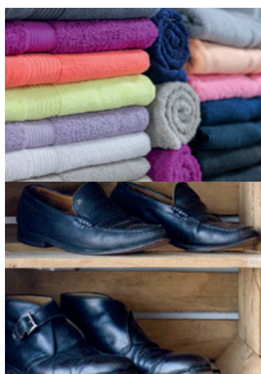
Frottée und Schuhe.

Bocklerstrasse 20, 8051 Zürich Freitag, 3. Juli 14–18 Uhr Samstag, 4. Juli 10–16 Uhr Änderungen bleiben vorbehalten! Infos: Margrit Oertle 044 321 23 66 und Familie Zogg 044 321 14 74