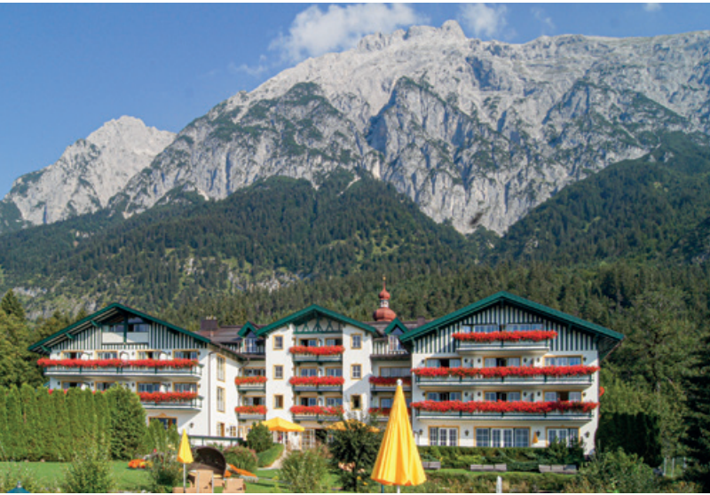
Hotel Speckbacherhof in Gnadental, Österreich.