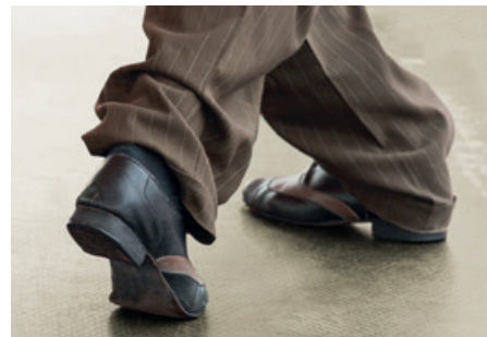
Tango, eine Leidenschaft.

Nach fast drei Monaten konzertanter Stille dürfen die lebendigen Klänge der Musik die Räume wieder füllen. Wir laden Sie zu unserem vom Tango inspirierten Konzert herzlich ein!