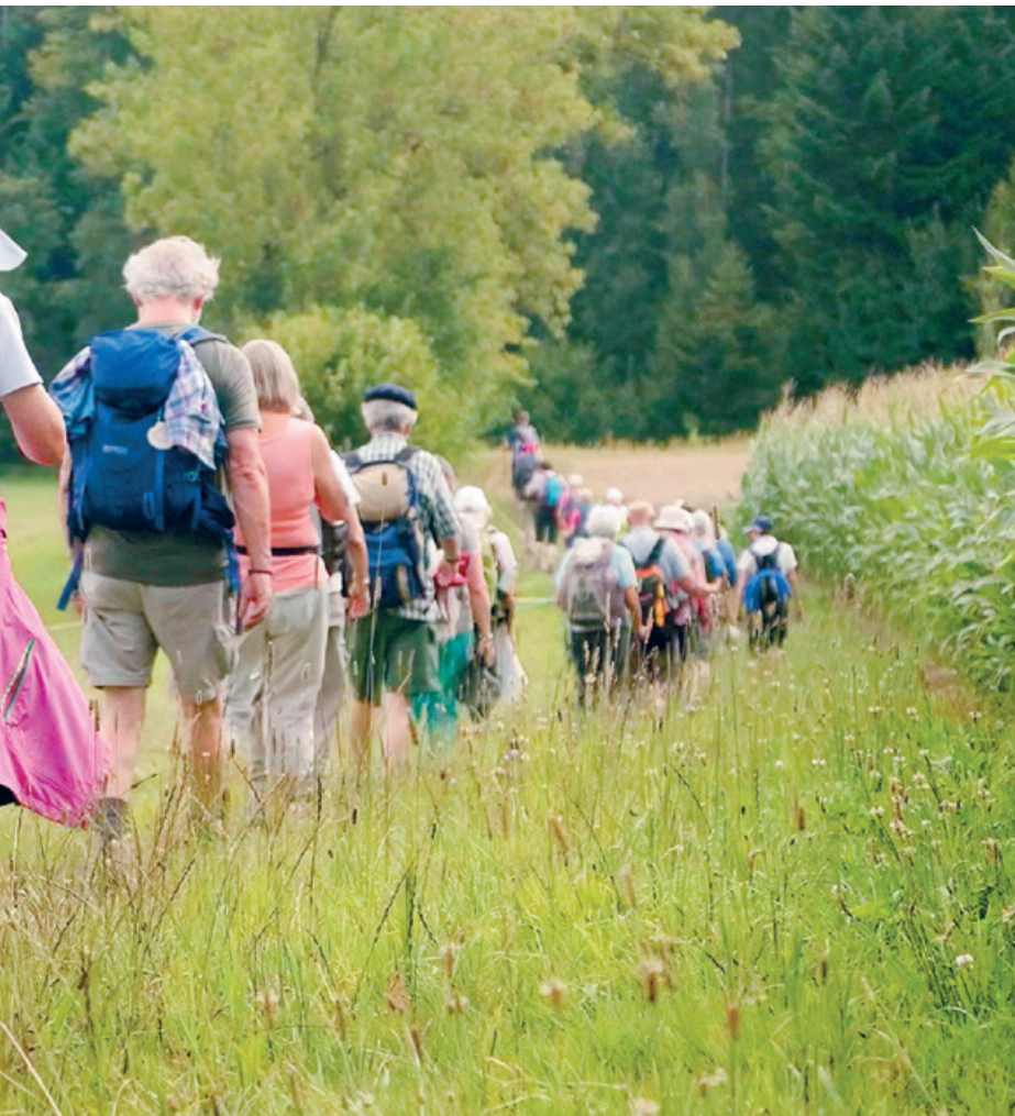
nde unterwegs.