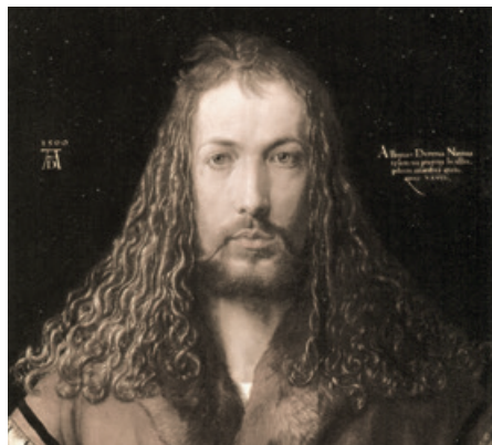
Betende Hände (l) – Selbstbildnis, Albrecht Dürer im Pelzrock (r). Bilder: wikimedia