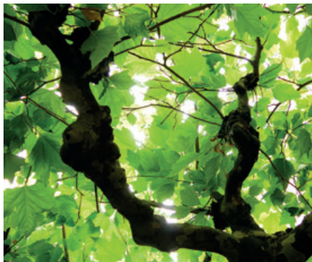
Schattenspendende Platane.

Und so wollen auch wir über Irrwege und Wegweiser miteinander nachdenken. Da bei jeder Wanderung auch der Proviant nicht zu unterschätzen ist, werden für uns Leckereien vom Grill, Salate, Kuchen und Glace vorbereitet, damit wir uns gesättigt – mit Wort, Musik,