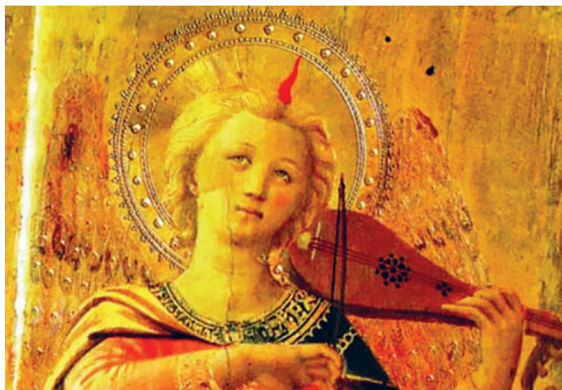
Fra Angelico, Engel mit Geige.

Mi, 25. Dezember, 10 h Gottesdienst zu Weihnachten mit Abendmahl Kirche Neumünster Pfr. Res Peter