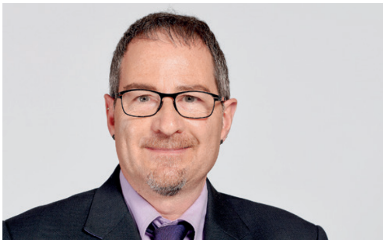
Matthias Reuter.

K aum ein Bild ist so sehr Inbegriff des christlichen Glaubens wie die Darstellung der Geburt Jesu. Maria und Josef, dazu das Kind in der Krippe. Ochs und Esel im Stall gehören dazu, ausserdem die Hirten auf dem Feld mit ihren Schafen und der Engel, der die frohe Botschaft von Weihnachten verkündigt. Vielleicht auch die Heiligen drei Könige, die dem Stern gefolgt sind: Caspar, Melchior und Balthasar. Schnell bin ich bei einer grossen Krippendarstellung versucht nachzuprüfen, ob auch ja alle Figuren dabei sind. Oder ob die Krippengestalterinnen kreativ weitere Figuren dazugestellt haben.