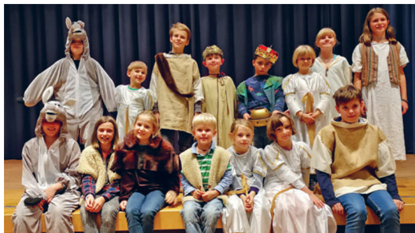
Die Kinder des Krippenspiels freuen sich auf die Aufführungen an der Familienweihnacht.

Mittwoch, 4. Dezember, im Anschluss an den Unterricht Alle sind eingeladen! Infos bei Tania Oldenhage