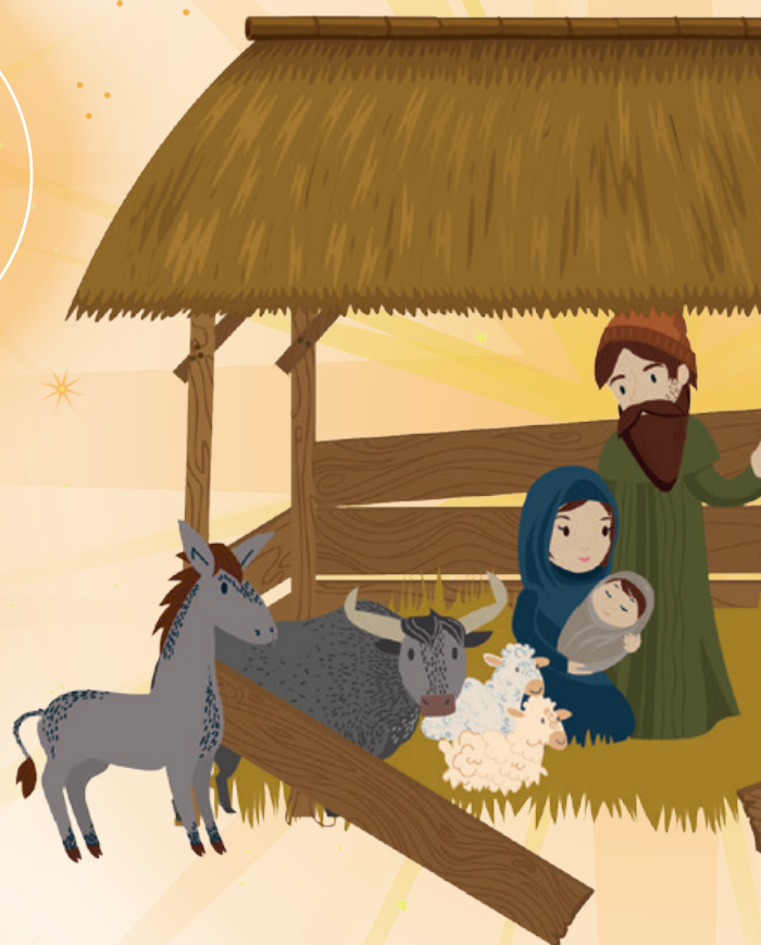
Illustrationen: Manuela Murschetz

Sie steht auf dem Fenstersims oder neben dem Kaminfeuer – und grosse Fest im Kreis der Fami