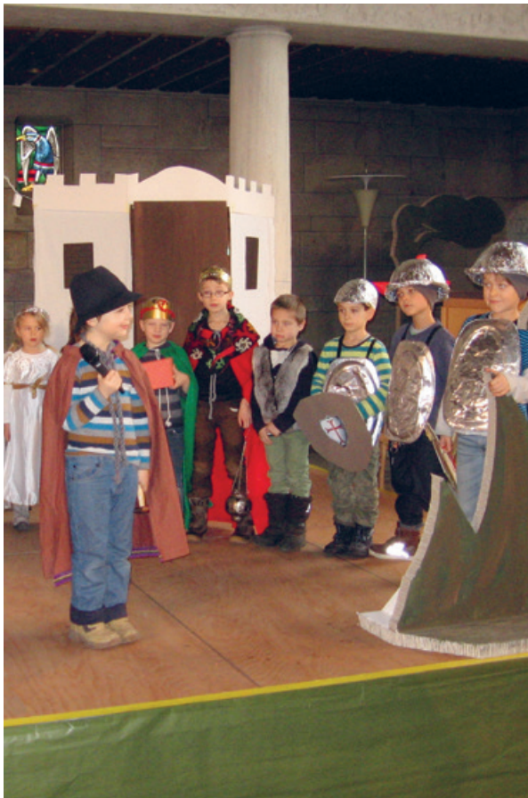
Josef begegnet Hirten, Königen und Soldaten.