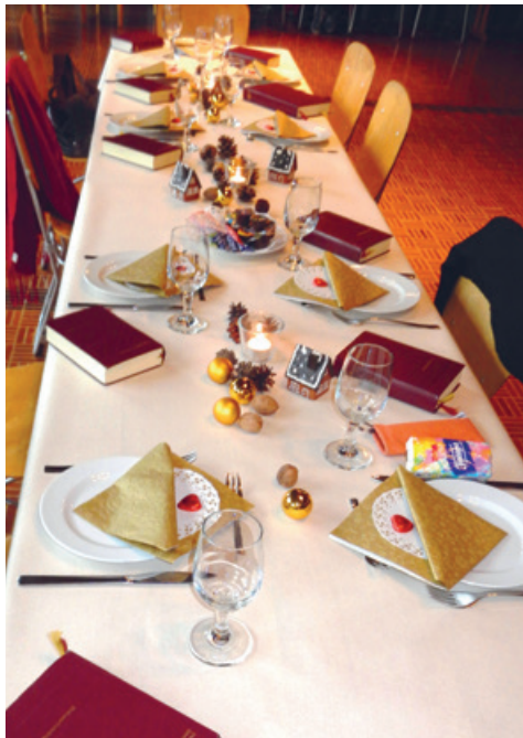
«Willkommen zu Tisch»