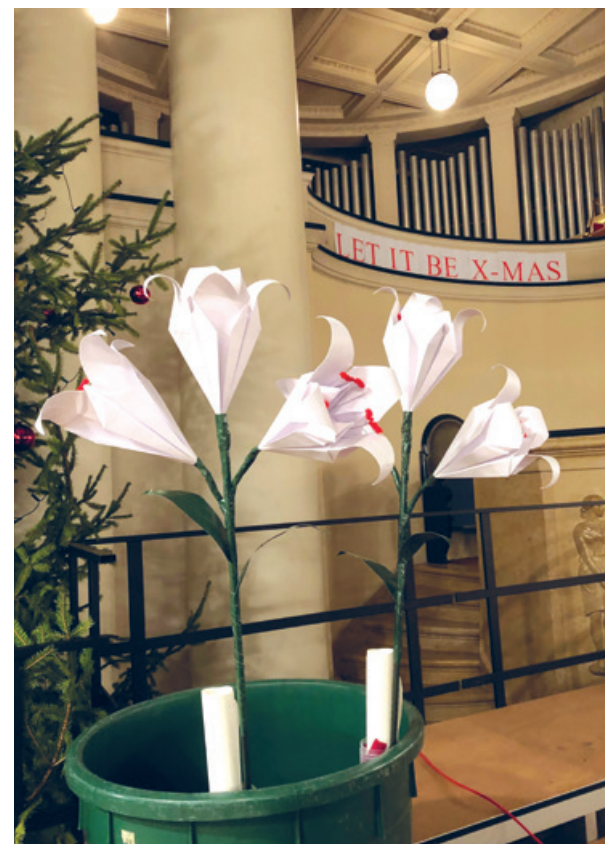
Im letzten Krippenspiel tauchen Lilien auf.

Samstag, 21. und Montag, 23. Dezember, 9.30 – 12 Uhr, Proben Dienstag, 24. Dezember, 17 Uhr, Gottesdienst. Anmeldungen bis zum 15. Dezember bei Tania Oldenhage