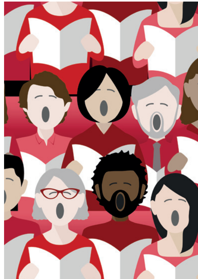
«Let's get together and feel alright.»