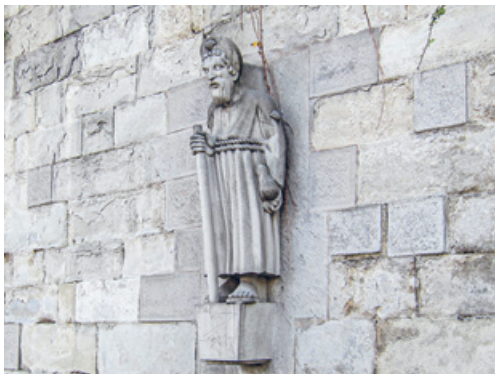
Pilgerbrunnen an der Stampfenbachstrasse