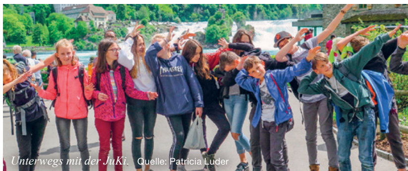
Unterwegs mit der JuKi.

FÜR TEENIES UND JUGENDLICHE DER JUKI 6–8