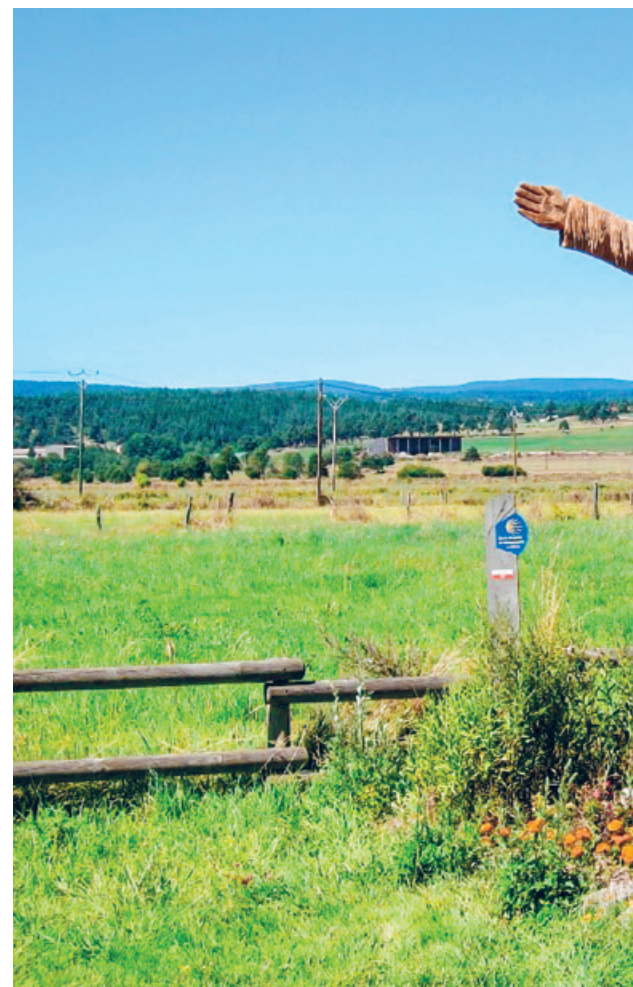
Die Jakobspilger verkörpern die wandernde Kirche, Pilgerfigur

Nächstes Datum: 14. April, ca. 9–17 Uhr Ausführliche Informationen im Flyer, im Internet unter reformiert-zuerich.ch/sechs oder bei Eva Haupt, 079 669 74 04