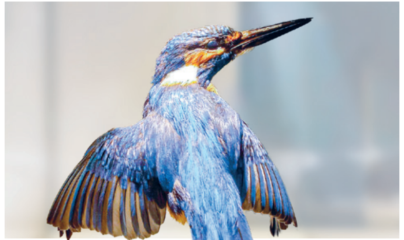
Der heimische Eisvogel.