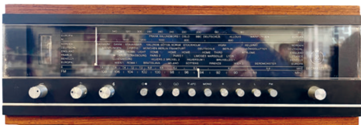
Radio «Beomaster 900».

Um möglichst vielen Personen die Möglichkeit zu geben, den Vortrag zu besuchen, wird er wie folgt angeboten: