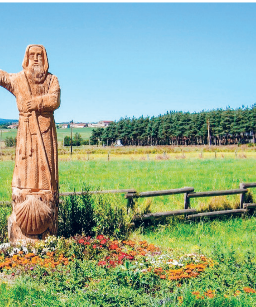
in Frankreich.

4. April, 14.30–16 Uhr Moderatorin: Ursula Gull sarita.ranjitkar@reformiert-zuerich.ch