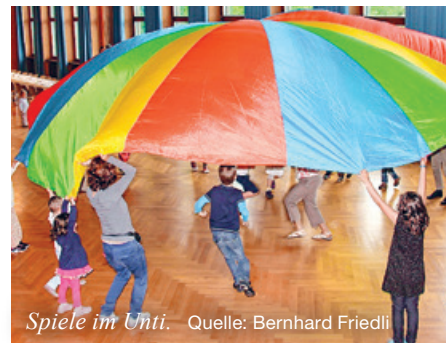
Spiele im Unti.

Ab der 2. Klasse geht es in der reformierten Kirche los mit dem kirchlichen Unterricht auf dem Weg zur Konfirmation. Wir freuen uns, Sie und Ihr Kind auf diesem Weg begleiten zu dürfen.