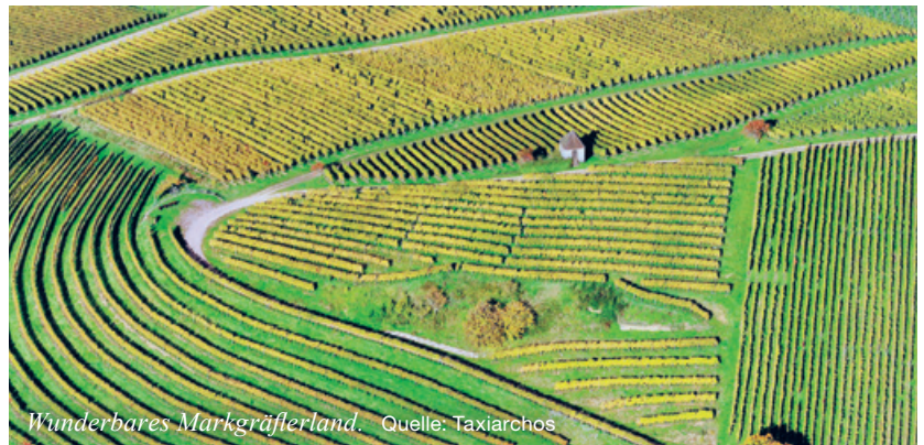
Wunderbares Markgräflerland.

Mittwoch, 19. April, 14.30 Uhr Auskunft: Monika Hänggi, 044 253 62 81 monika.haenggi@reformiert-zuerich.ch Guthirtstrasse 7, 8037 Wipkingen