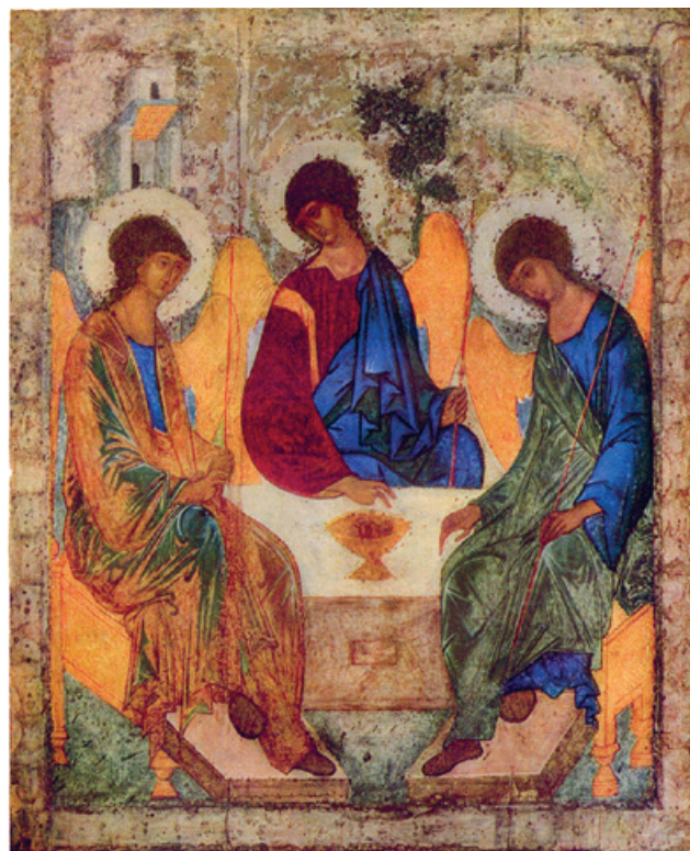
Dreifaltigkeitsikone, André Rublë.

Die Dreieinigkeitslehre ist auch ein schöner Ausdruck der göttlichen Vielfalt. Diese Lehre macht die christliche Gottesvorstellung sozusagen pluralistisch. Denn es sind ganz verschiedene Gottesbilder, die darin zusammenfließen. Wer Gott nur als Energie versteht,