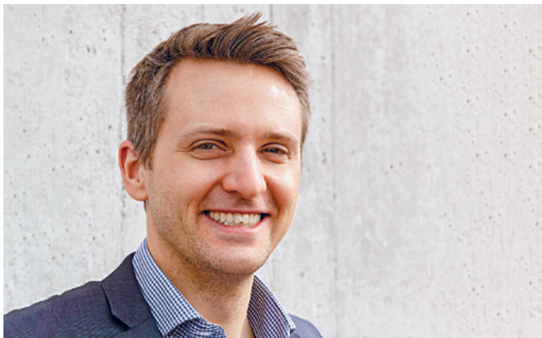
Michael Braunschweig.

E s sind sonderbare Zeiten, in denen ich als neues Mitglied der Redaktionskommission mein erstes Editorial an Sie richten darf. Viele fragen sich: Wo wird das hinführen, was mag noch kommen und wie werden wir in Zukunft leben können? Wer an Pfingsten üblicherweise gerne verreist, wird den Kontrast zu dem, was wir bisher als normal wahrnahmen, besonders stark empfinden. Auch wenn die Grenzen sich nun langsam wieder öffnen: Aus Vorsicht und Rücksicht werden Sie auf Pfingstreisen wohl verzichten müssen. Zudem müssen wir selber neue Grenzen ziehen, wo bislang keine waren. Durch den anhaltenden Ausnahmezustand wurde vielen bewusst, was wir sonst erfolgreich verdrängen: Wir sind eine Schicksalsgemeinschaft. Individuell und als Gesellschaft sind wir aufeinander angewiesen.