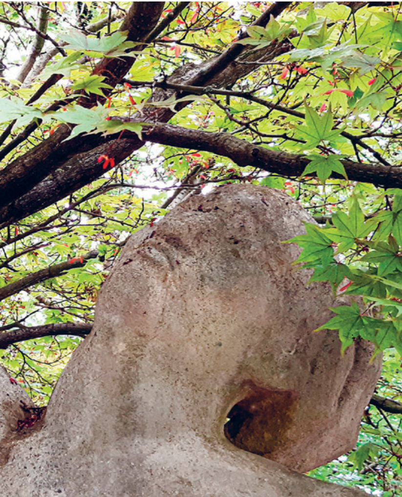
beim Limmathaus Zürich.

sen soll in Solidarität, Gerechtigkeit und Frieden. Gerade der Samaritaner als Angehöriger eines damals geschmähten Volkes sprengt auch die Begrenzung von Güte auf die eigene Nation oder gar Familie auf. Dabei spielt Jesus auch provokativ mit der Tatsache, dass der Fremde sogar derjenige ist, der vorbildhaft über alle Grenzen hinaus hilft.