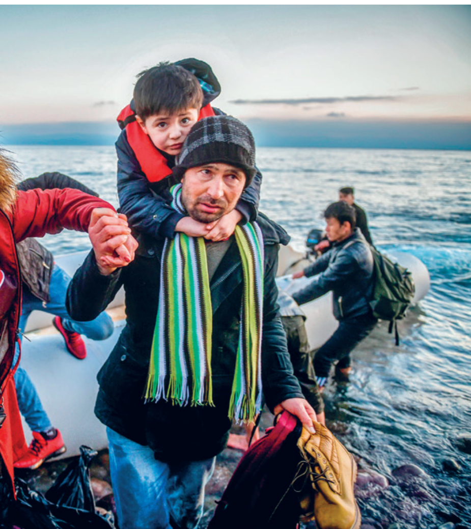
Ägäische Meer von der Türkei aus auf einem Schlauchboot.

finanzierten Lager in der Türkei und in Libyen. Die wenigen Informationen, die von dort an die Öffentlichkeit gelangen, sind erschütternd: Sie erzählen vom unfassbaren Leid, das Menschen auf der Flucht erleben. Seit 1993 sind mindestens 38 739 von ihnen beim Versuch, nach Europa zu gelangen, gestorben.