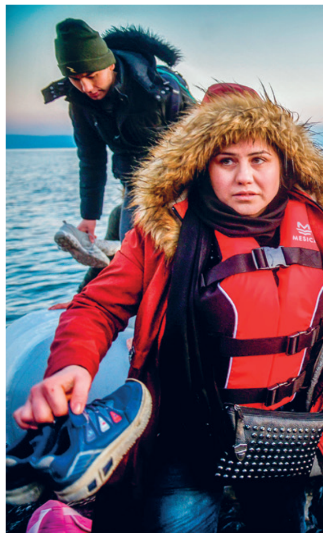
März 2020: Flüchtlinge erreichen Lesbos – sie überquerten das

Am 20. Juni findet der diesjährige schweizerische Flüchtlingstag und am 21. Juni der Flüchtlingssonntag der Kirchen statt. Für das Thema zu sensibilisieren ist wichtig – nicht nur trotz, sondern gerade wegen der Corona-Krise.